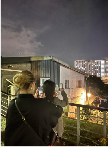
2023/03/31 公館 寶藏巖 我們在拍小村莊看出去的台北夜景，我拍她拍她

望我們還能再約！後來他家人來台灣，我學伴帶他們去吃公館的小螺波，還請我翻譯菜單，好難翻譯但很有趣哈哈，雖然不是台式料理，但很開心她喜歡！