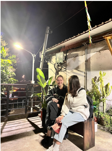
2023/03/31 公館 寶藏巖 我們都不喜歡拍照，所以一直相視對笑