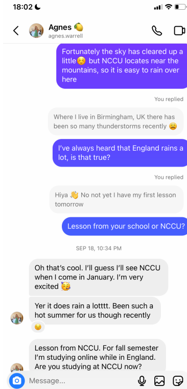
一些聊天記錄的截圖～