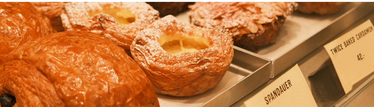
(雖然不重要但上圖其實是哥本哈根的烘焙店)

身為一個不太愛在圖書館做報告的人，在華沙期間我探索了一些筆電友善咖啡廳，想透過這篇電子報介紹給大家。