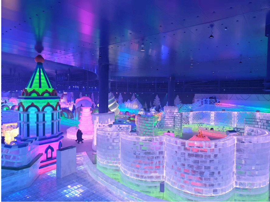
圖：哈爾濱室內冰雕館（也稱哈爾濱小世界）