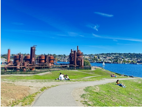
*Gas Work Park