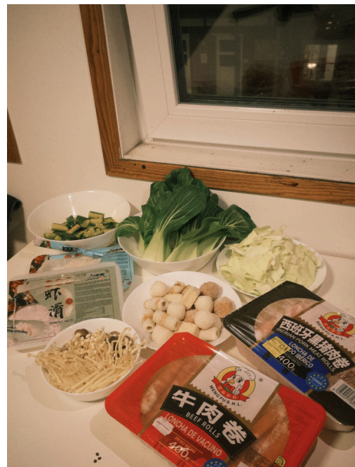
跟朋友的 hot pot night