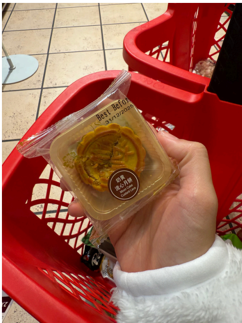
中秋節也買得到月餅！