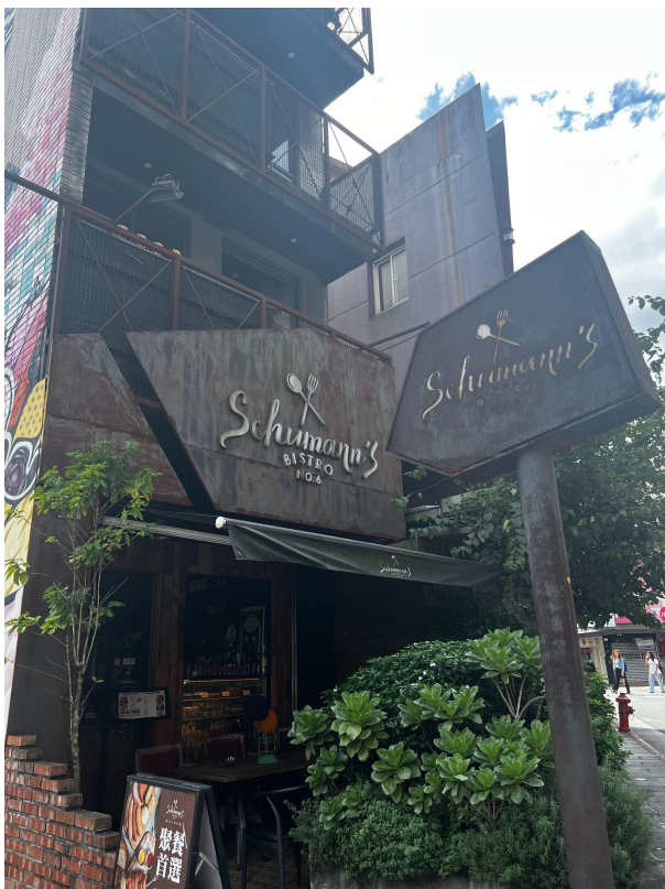
照片*2(含文字介紹、拍攝日期及地點活動名稱) 我們一起在學校附近的餐廳吃飯！