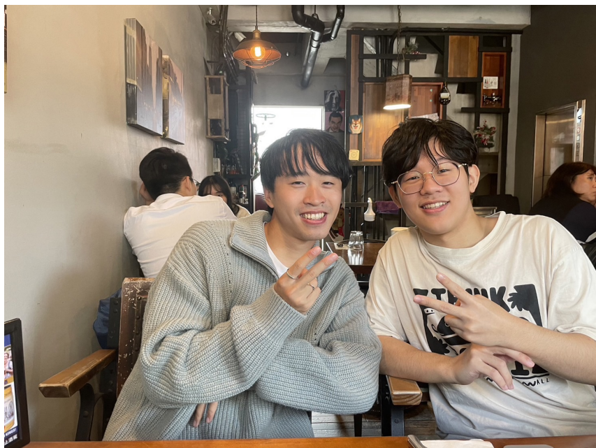
照片*2 (含文字介紹、拍攝日期及地點活動名稱)