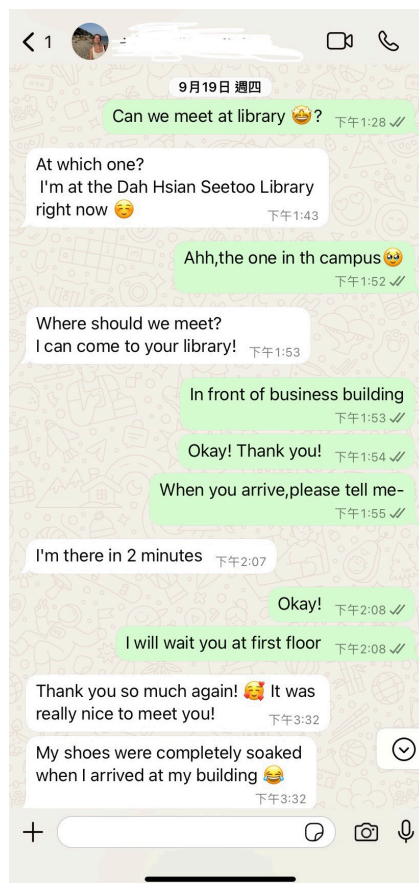
2024.9.19. 政大圖書館 台灣零食分享 (當日有見面聊天一小時左右，但沒有拍攝到照片，附上訊息佐證)