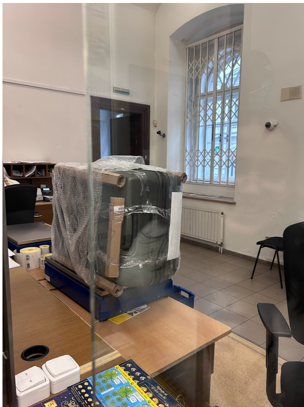
▲秤重中的行李 22kg 總共 1993 克朗 約台幣 2800 元

除此之外還有一個小插曲：原本工作人員跟我們說，行李箱不能郵寄、因為怕過程中撞擊、行李箱的輪子會損害到其他包裹（??），最後我們當場購買了泡泡紙、膠帶，把行李箱捆成了非常荒謬的樣子之後，他們就妥協讓我們郵寄了…可喜可賀。