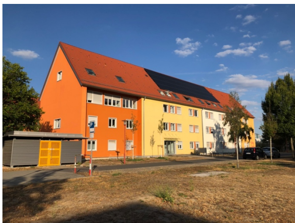
圖 3 Ulmenweg Haus 5 外觀

至於共用衛浴和廚房的話，真的很看你遇到什麼樣的室友，我的室友是兩個美國女生、一個法國女生、一個西班牙女生跟一個義大利男生，他們都還算乾淨，但一定還是偶爾會有髒碗盤堆積在水槽的時候，所以我都用自己的洗手台洗東西 XD