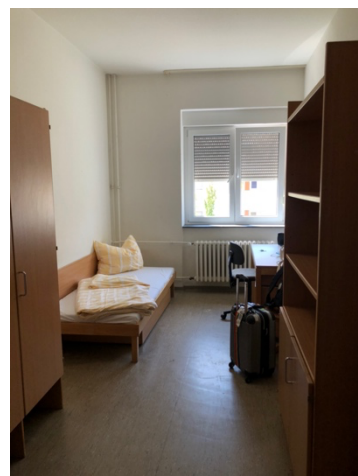
圖 4 Ulmenweg 六人房房間