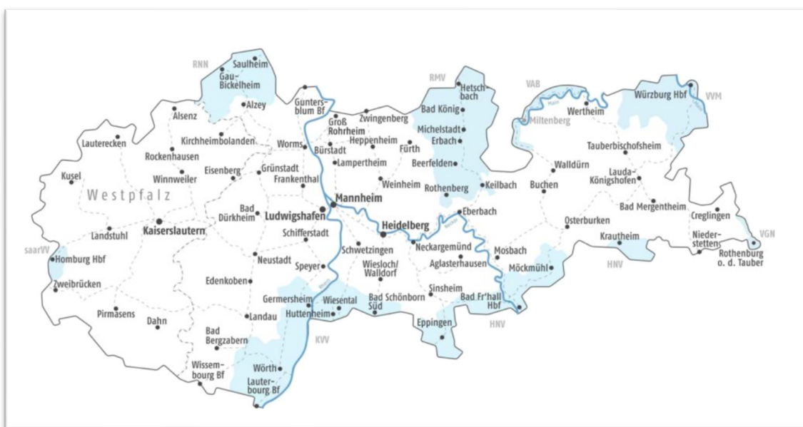
圖 6 VRN 範圍