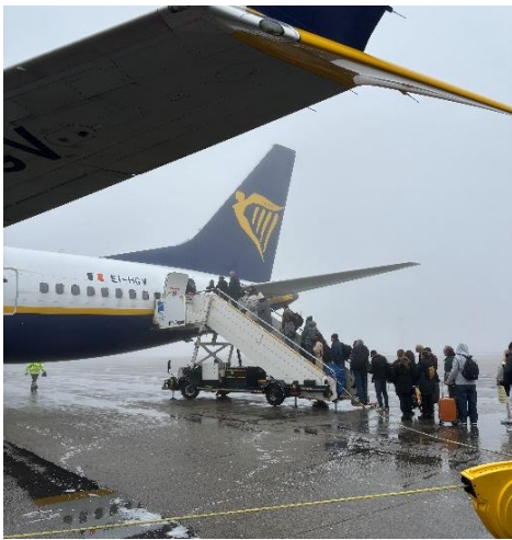
▲在 Charleroi airport 搭乘 Ryanair