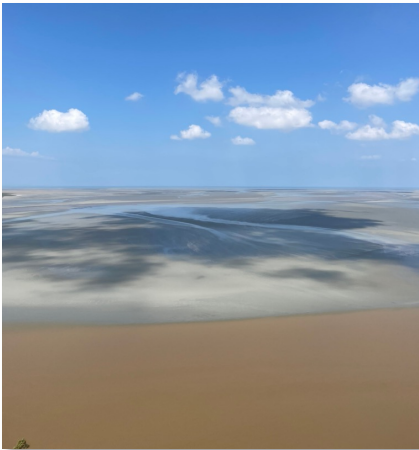
聖米歇爾山潮間帶

來雷恩還可以順便去公車車程約 1.5 小時的世界文化遺產聖米歇爾山 Mont Saint Michel。剛好我去的那天天氣很好，所以非常漂亮，幸運的話還有機會看到漲潮時形成的孤島；聖米歇爾山島內的觀光區、修道院也很值得一逛，有各式各樣的特色小店和歷史古蹟。