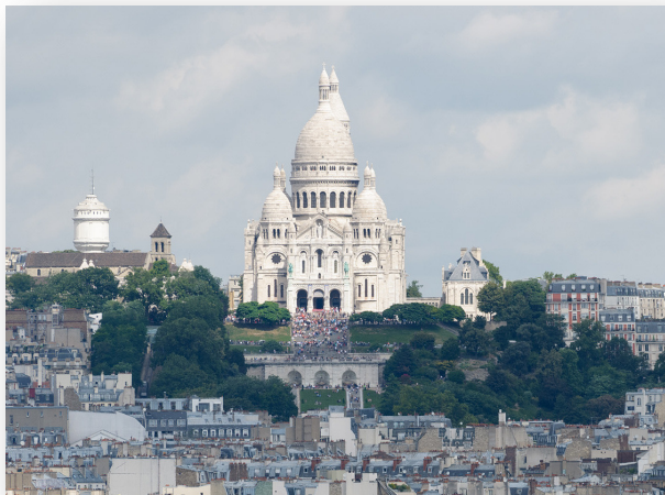
蒙馬特高地

盧森堡公園： 佔地很大、超級適合發呆的公園！裡面有很多個區域，噴水池、草地、樹林、遊樂區等等，也放了很多椅子可以隨時坐下。中午可以帶午餐去野餐，到下午就看本書發發呆或睡午覺、跟朋友聊天，非常舒服，可以就地體驗到歐洲人生活樂趣之一的公園放鬆行程。