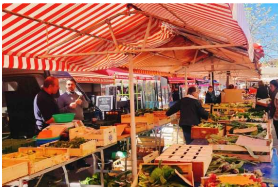
尼斯市集

尼斯是南法普羅旺斯省的大城，其所在的區域被稱為「蔚藍海岸」，天氣好的時候真的非常漂亮，可以看到很多人在沿岸沙灘上曬太陽、戲水。到尼斯還能去他們的老城區晃晃，有許多生鮮和二手市集可以挖寶。我覺得是一個很適合度假的樂活城市。