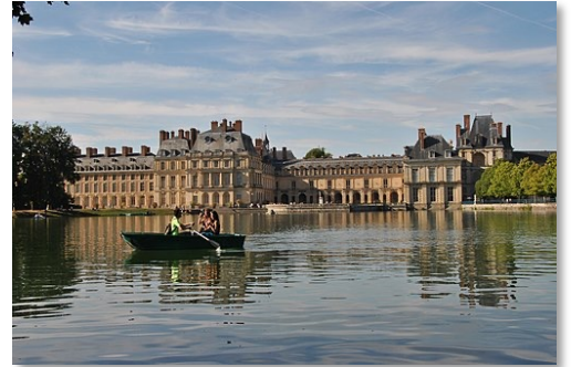
楓丹白露宮