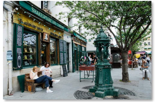
拉丁區一隅

楓丹白露宮： 位在巴黎東南方郊區的楓丹白露小鎮，從12世紀起用作法國國王狩獵的行宮，也是法國最大的王宮之一，曾是路易七世到拿破崙三世等法國君主的住所。因地理位置偏遠、離巴黎搭車大約需要 2 小時，所以相較起其他景點的遊客要少很多，不喜歡人擠人但又很喜歡皇宮的人超級推薦去那邊走走。皇宮雖然沒有凡爾賽宮那麼奢華，但也是應有盡有、裝潢低調典雅；皇宮旁更有三個花園，很適合天氣好時花一個下午去散步。