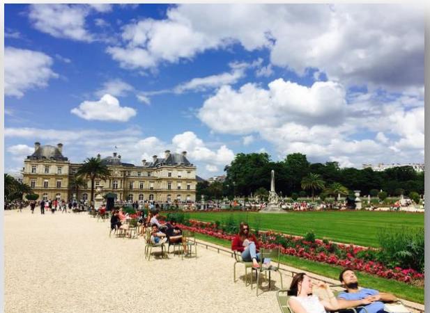
盧森堡公園一隅