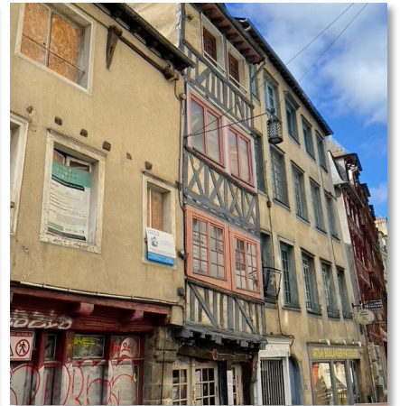
可愛的歪歪傳統建築