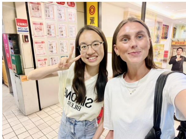
我與buddy的第一次見面，我們約在Lazy Pasta一起吃飯聊天！