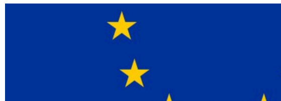
歐洲交換學生 Exchange Students in Europe ● 私密社團 · 1.7 萬位成員