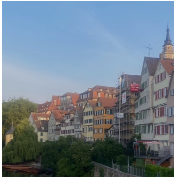
德國二手拍賣 228名成員 23則貼文