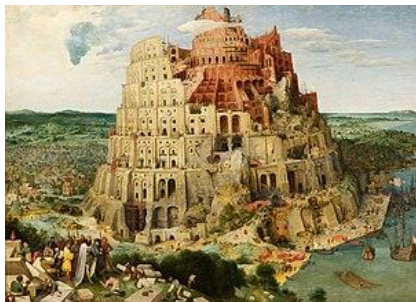
< The Tower of Babel

藝術史博物館比較多人去，我自己也是只去了藝術史，裡面的館藏多到至少要看一個下午，其中比較有名的包含 Pieter Bruegel 的巴別塔 ( The Tower of Babel )，是一幅充滿細節可以細細品味的畫。