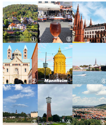
8個城市的一些照片