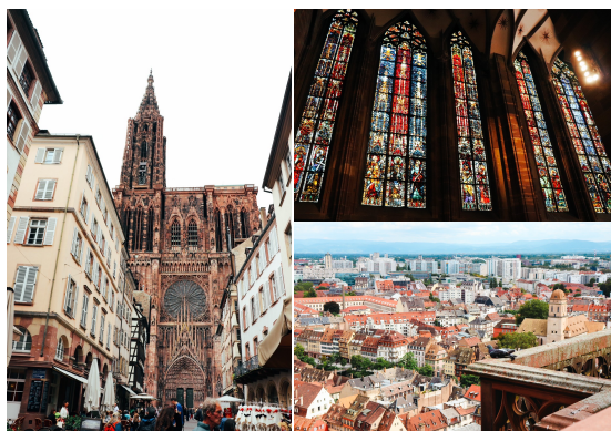
8月的史特拉斯堡大教堂

其實史特拉斯堡並沒有被列於Deutschlandticket內，不過若從曼海姆出發，可以選擇先搭慢車至Kehl（屬於德國境內），補買最後一小段Kehl到Strasbourg的車票即可！