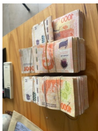
(每次換錢都像毒梟，圖為 30000 台幣等值之阿根廷披索)