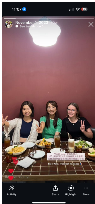
11/17 信義區義大利麵餐廳.

即使相隔兩地，我們仍透過 Instagram 保持跨文化對話。當我到上海交換時，Buddy 對亞洲文化的持續好奇成為我們的新話題。這種長期互動讓我體悟：真正的文化交流不在於短暫相遇，而是能在不同人生階段持續激盪思想，並成為推動彼此探索世界的動力。