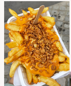
Friterie du Perron

這是列日當地比較有名的薯條店之一，如果2個人，點小份的已經非常足夠了。但我覺得沒有到非常驚艷的味道，感覺可以去探索其他更棒的店。