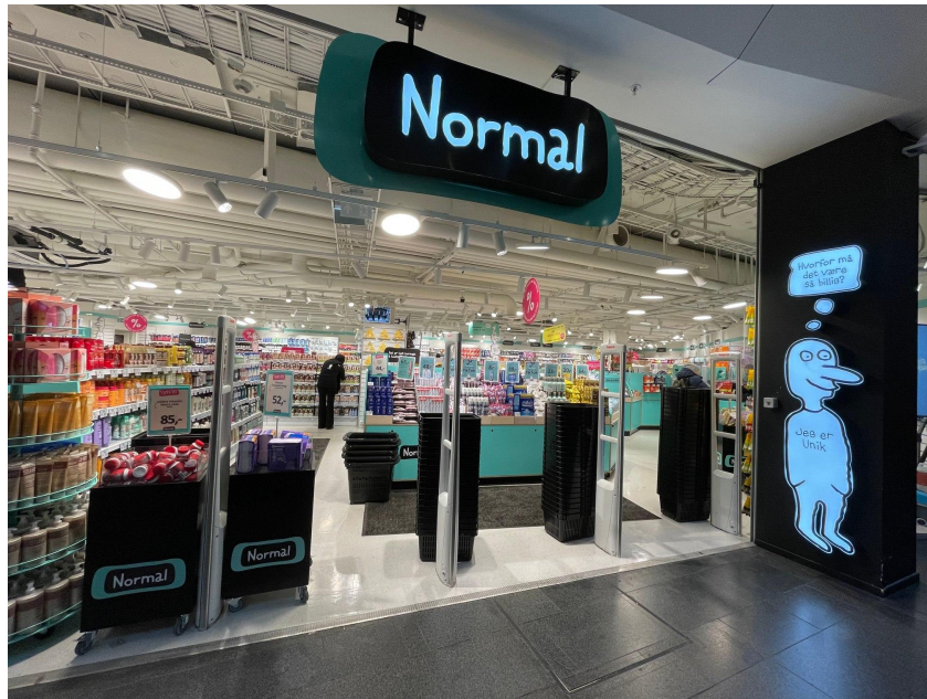
(Normal, Oslo City)

應該還有很多沒列出來，但這些是我覺得生活中「可能」會比較需要的，當時的我出發前整理行李時總是很怕什麼沒帶到、然後挪威又沒有，事實證明我多慮了 XD，人家這麼高度發展的國家怎麼可能會沒有 🤖