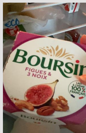
大推的超市奶酪， 沾法棍好吃!