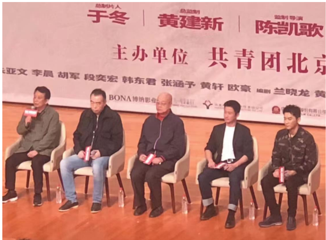
圖：長津湖主創團隊到北大

如這學期便有邀請今年的票房冠軍—長津湖的導演和演員來北大和大家互動，這個入場資格也是非常難搶，畢竟能夠有機會在北大見到知名導演或演員的機會也非常難得，但一般會有主創團隊進北大的電影都是紅色題材的電影唷。