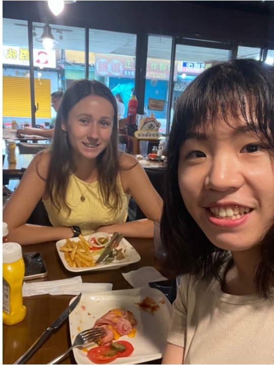
9/13 在 Juicy Bun 和 Maud 第一次見面