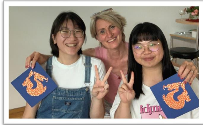
我和其他交換生朋友與英文老師的合照