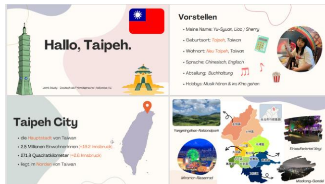
向德文課同學介紹我的家鄉

德文課的選課是和其他課分開的，要從LFU網站的語言中心進行選課。雖然我來之前有上過一學期的德文，但我還是從最簡單的 A1 開始。這裡的教學速度我認為比起台灣快蠻多，並且老師會帶大家進行各種不同的課堂活動，一個禮拜上兩次，整體的學習效果我認為也比我在政大上的好。而語言中心的規定是整學期不能缺席超過五次，有期中期末考、3份 written assignment 以及個人報告。期中考期末考形式類似，但期末考多了口試，兩人一組隨機抽取兩個課次進行對話，只要有準備成績都不會太難看。written assignment 大概 70-100 字，主題會跟課程有關。個人報告則是介紹自己的家鄉，整體來說我覺得這門課很充實，老師也很親切可愛，上完一學期能深刻地感受到自己德文的進步！