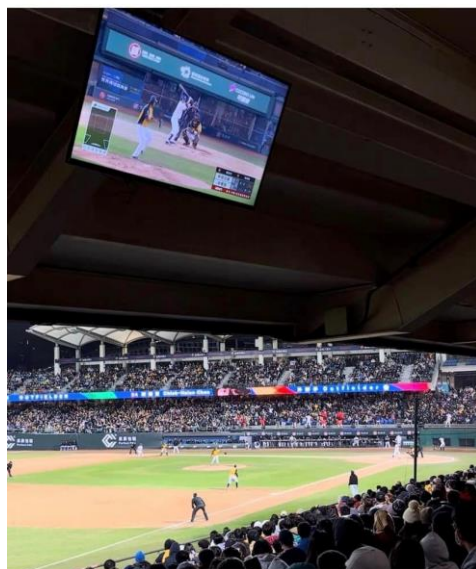
385 個讚 leolikka Taiwanin tunnelmia 3月13日 · 翻譯年糕