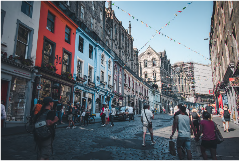
Victoria St., Edinburgh

愛丁堡是蘇格蘭王國的首都，僅次於格拉斯哥的第二大城。愛丁堡主要由新城區和舊城區組成，在1995年就被聯合國教科文組織入選為世界文化遺產，走在愛丁堡的舊城區，能夠深刻的體會被歷史、古蹟包圍的感覺，除此之外，在愛丁堡也可以體驗到與英格蘭非常不同的蘇格蘭文化，像是風笛、威士忌、Kilts、Haggis等。由於處於高緯度地區，年均溫約10度上下，此外也經常下雨，最適合旅遊的季節為夏季，是我認為英國僅次於倫敦最迷人的地方。