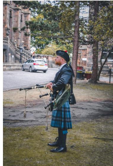
蘇格蘭傳統服飾及風笛