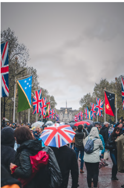
King Charles III 加冕典禮