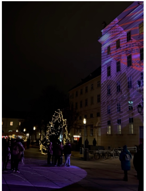
上排和左下是跨年