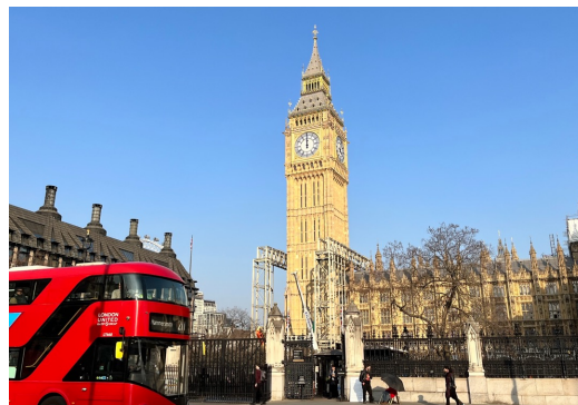
英國大笨鐘與紅色公車