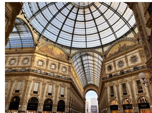
義大利米蘭奧曼紐迴廊