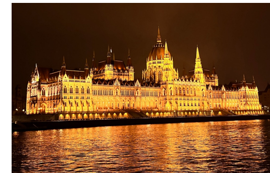
布達佩斯國會大廈夜景超美