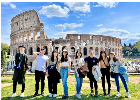
羅馬競技場with 超棒的旅伴們！！