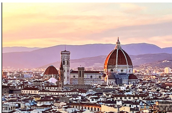
佛羅倫斯百花大教堂夕陽