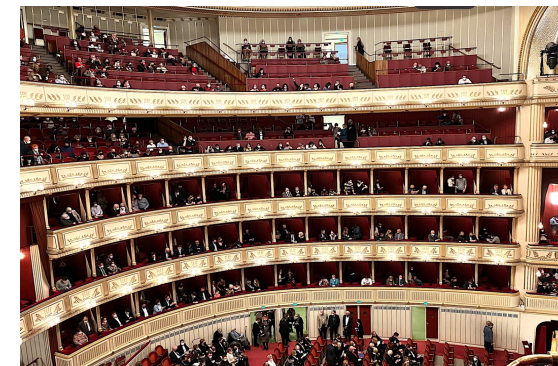
維也納歌劇院（大推聽歌劇！）