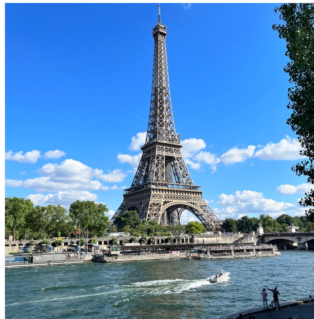
法國巴黎鐵塔與羅浮宮