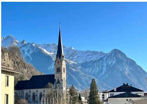
瑞士跟奧地利中間的小國：列支敦士登