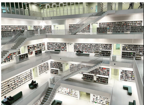
德國斯圖加特美術館，比達賢蓋的早，我覺得超級像