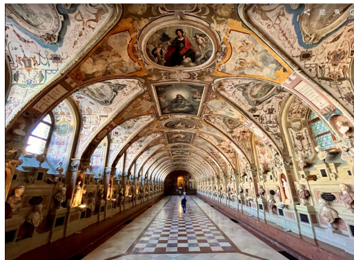
德國慕尼黑王宮（大推，覺得比奧地利熊布朗宮還讚）