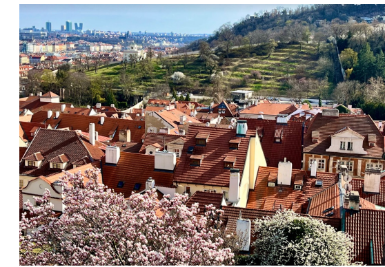
捷克布拉格有很多可愛橘色房子