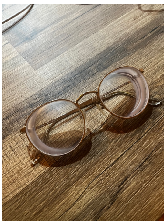
（終於拿到的新眼鏡）