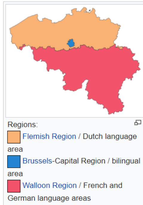
圖 2 比利時行政區(regions)分布圖