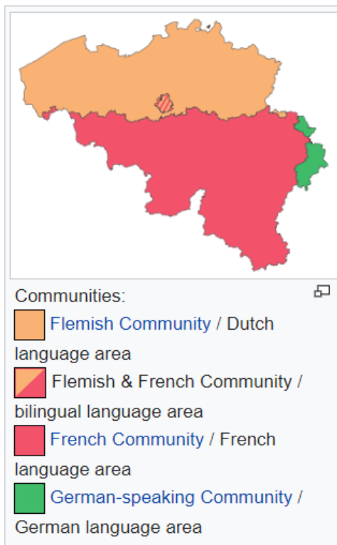
圖 1 比利時社區(communities)分布圖

雖然比利時和美國一樣屬於聯邦政府，但為了確保各文化能夠和平共處，不僅聯邦政府組成中荷語閣員和法語閣員的數目必須相同，比利時在聯邦政府之下又根據其官方語言——弗拉芒語(Flemish，荷語的分支)、法語、德語三個語言族群設立了三個社區政府，分別是荷語社區、法語社區、德語社區；另外，又設立了法蘭德斯區(Flanders)、瓦隆區(Wallonia)、布魯塞爾首都區(Brussels)三個行政區政府。在這個體制下，聯邦政府執掌與國家整體利益攸關的事物，例如外交、國防、公共安全、社會福利等；社區政府掌控該社區的教育及文化；而行政區政府則負責該行政區的經濟規劃、環境、公共建設等等。其中，社區政府和行政區政府彼此覆蓋但非全部重疊——法蘭德斯行政區政府和荷語社區政府合併為一個統一的法蘭德斯政府；瓦隆行政區則大致上覆蓋了法語社區和德語社區；布魯塞爾行政區本身融合了三種語言，但以法語人士為大宗。所以實際上包含聯邦政府在內，比利時共有 7 個政府各司其職。說到這裡大概腦袋都已經打結了，所以我將社區和行政區的分布範圍以及各政府職掌示意圖放上來以供參考：