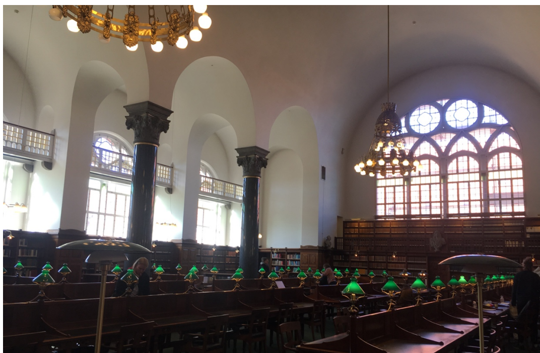
木書桌區。離開前拍了張照才發現裡面好像不能拍照... (但我捨不得刪)