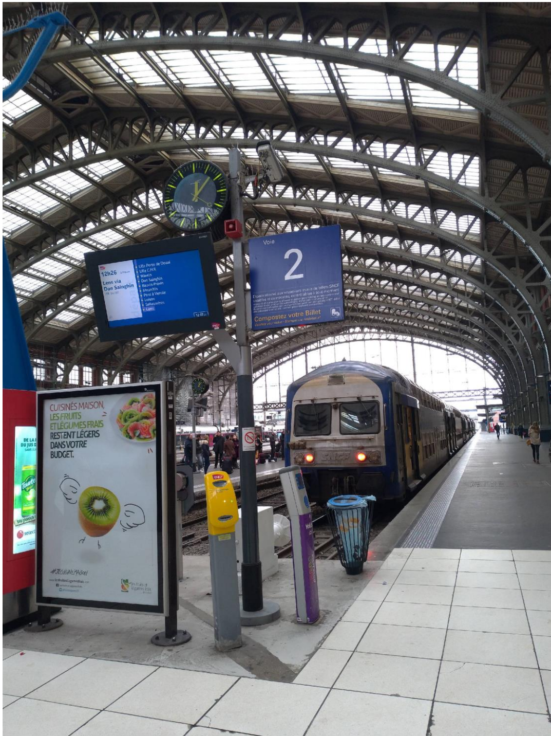
Lille Flandre 火車站沒有驗票閘門的月台及黃色打票機