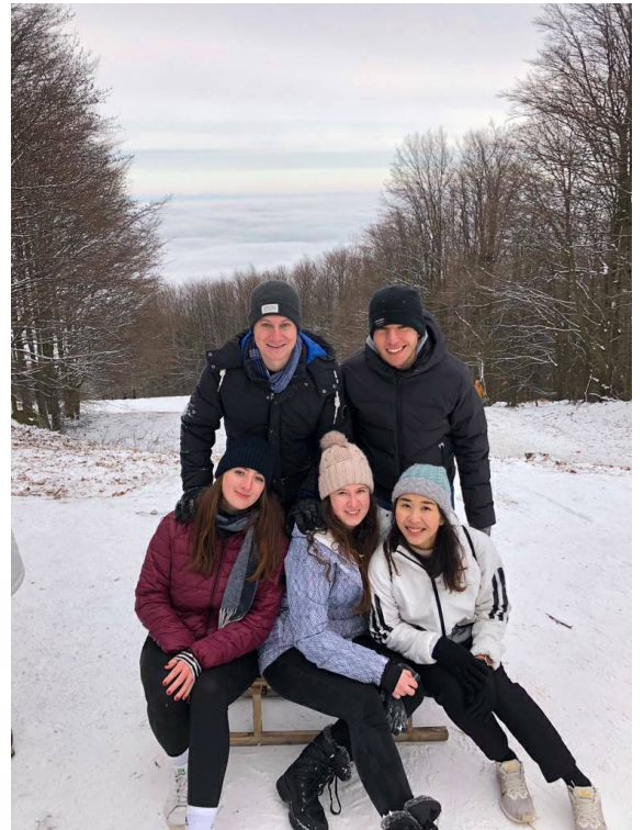
一月份的Kékes，我們到此玩snow sliding

八月底來到布達佩斯時，這裡的天氣和台灣夏天極為類似，高溫可以來到三十度。但是到了九月中，天氣開始轉涼，日夜溫差可達十度以上，若是晚上外出別忘記帶件外套。直到十月底，氣溫來到十度左右，大概是台灣冬天的極限了吧！但好處是溫帶大陸性氣候使布達佩斯的冬天不像台北一樣濕冷，即使偶爾下了雨，外國朋友也是沒有再撐傘的！十一月氣溫大約就是五度左右了，十二月份氣溫偶爾在零度徘徊，2020冬天的布達佩斯沒那麼冷，一直到一月初才下了初雪。今天因為封國界的關係，冬天沒什麼娛樂，不然往常的話，政府會將城市公園的河水抽乾，製造人工的冰河，可以入場溜冰，記得門票約在台幣一百上下。若是想在匈牙利體驗滑雪的話，也可以在冬天造訪匈牙利境內最高的山Kékes，海拔1014m。