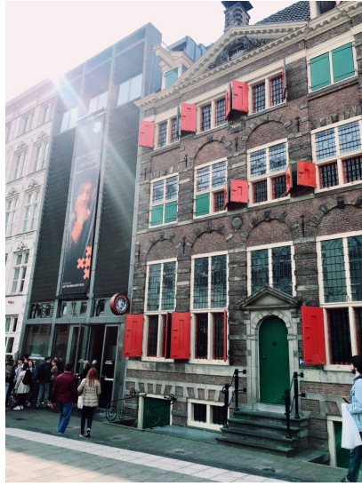
林布蘭故居博物館