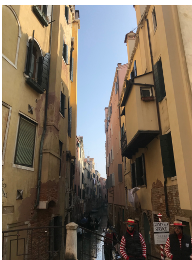
城市一隅與貢多拉船夫