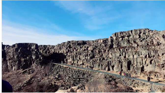
辛格韋德利國家公園（中洋脊露出海平面以上）