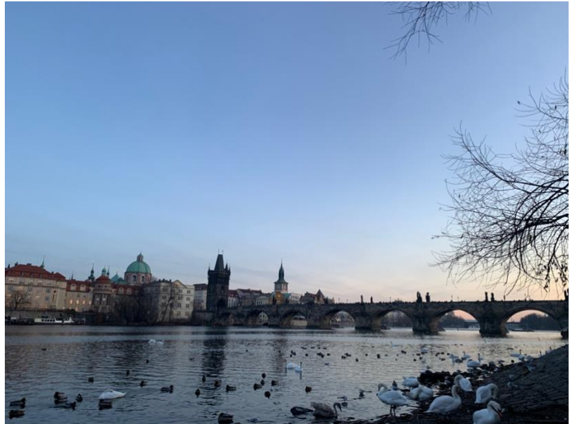
Prague, Czech Republic