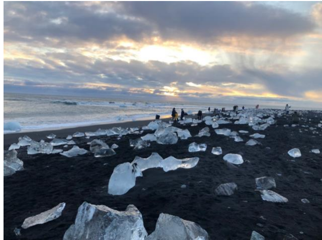
Diamond Beach, Iceland