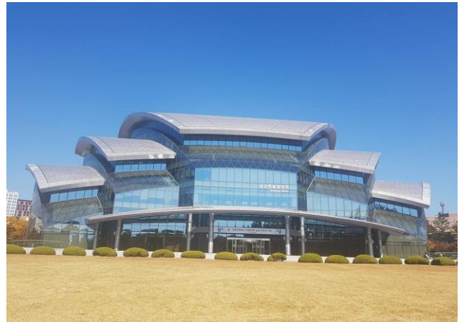
位於水原校區的三星綜合情報館(圖書館)

根據 2017 年韓國中央日報大學評價排名，成均館大學超越「SKY」當中的延世大學(연세대학교，延世大學校)和高麗大學(고려대학교，高麗大學校)，排名全國第 2，僅次於首爾大學(서울대학교，Seoul National University)。