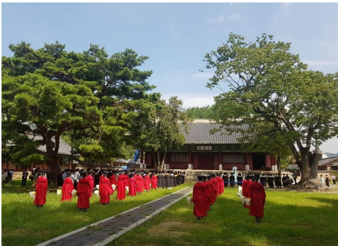
於成均館大成殿舉行的夏季畢業典禮