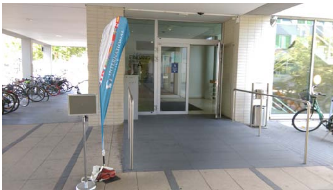
圖二、位於 L 1, 1 的 International Office 門口

註冊程序分為兩個步驟，第一步驟需繳交與提供 要求文件等資料 ，另外請記得攜帶限制帳戶的銀行帳號。完成第二步驟前，需要確認提供之保險有效性，會要求到指定專業保險公司確認，取得證明單據，再繳交回 International Office 以完成第二步驟。通常會告知最近的保險確認位置位於 Mensa (學生餐廳) 門口的 AOK (見圖一之虛線紅圈、圖三)。