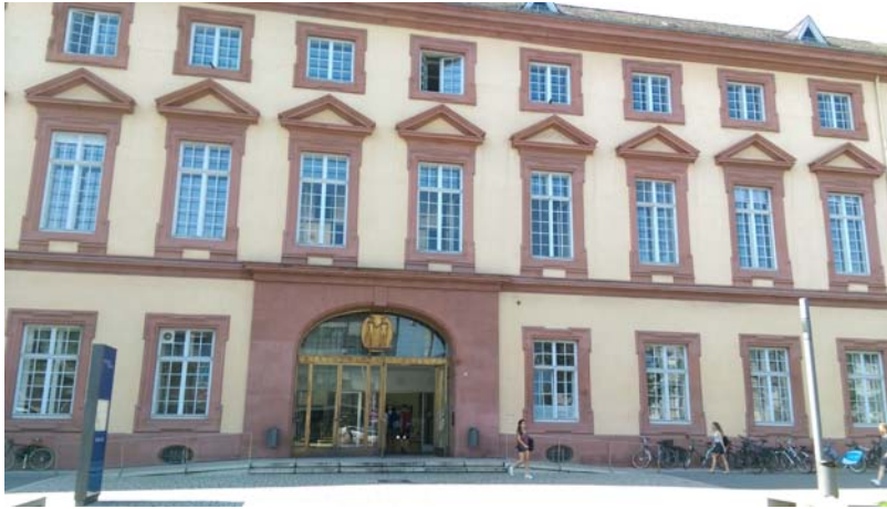
圖四、Ostfluegel (Main Entrance) 大門