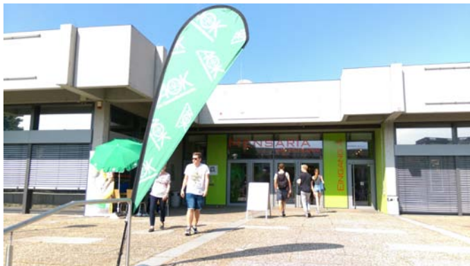
圖三、AOK 臨時攤位設於 Mensa 門口側邊 (綠色傘與綠色旗幟)

註冊完成後，會告知第二天可以到 Info Center 拿取學生帳號，InfoCenter 位於西側 SW，從 Ostfluegel (Main Entrance) 進去 (見圖一之紅色星號；圖四)，右轉出去後可以看到指標寫 InfoCenter 與 UB (圖書館)。