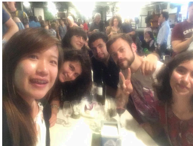
西班牙南部佛朗明哥舞為名的小酒吧，一起看秀的同桌