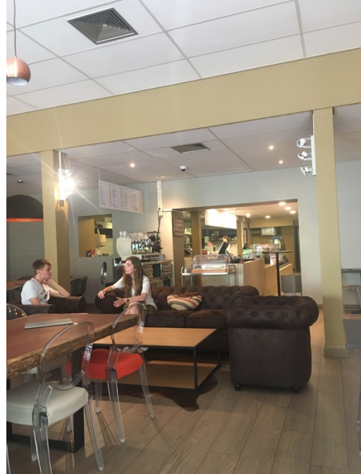
校園裡稍貴但很好聊的咖啡店

宿舍本身雖然比較舊，但是該有的設備都有。交換生住的房型是雙人房，房間內每人都有一張床、衣櫃、桌子，床的旁邊有小燈以及插座，房間內有大置物櫃可以放廚具，房間內備有溫暖的暖氣。每一層樓都有廁所、浴室、廚房、還有自習室。自習室以及廚房各自都有一台冰箱，自習室的 wifi 最強。建議每間房間都自己再去牽網路會比較好，不然基本上很弱，我的做法是與室友還有隔壁的兩位鄰居一起 share 網路費，我們辦的是 VOO，市區有很多門市建議去門市了解資費後再決定，因為每一季的費用還有方案都會有所不同。宿舍比較麻煩的是沒有洗衣房，必須走出宿舍右轉走大約 1 分鐘才會到自助洗衣店，一次要價 3.8 歐不含烘衣，烘衣一次 0.8 歐元且通常要烘兩次衣服才會乾，但比利時本身氣候乾燥，衣服一天之內都會乾。宿舍一樓備有自動販賣機，以及飲水機。但必須要說的是，歐洲的水都是硬水，煮出來都會有一層白白的鈣浮上來，建議到超市買瓶裝水或是買濾水壺較乾淨。