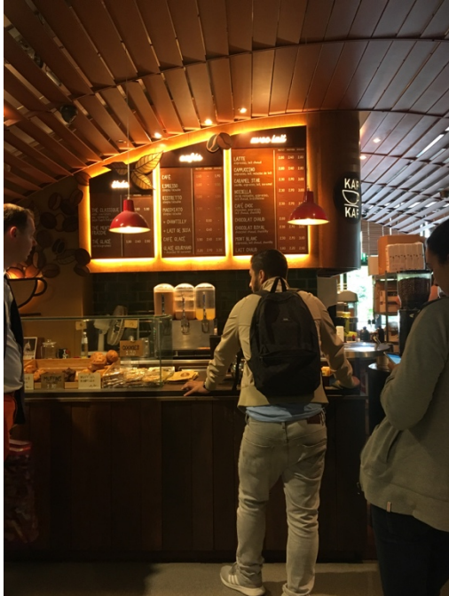
校園裡很好喝的咖啡店