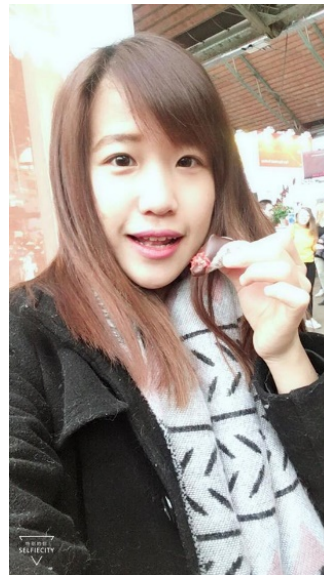
一年一度的比利時巧克力展