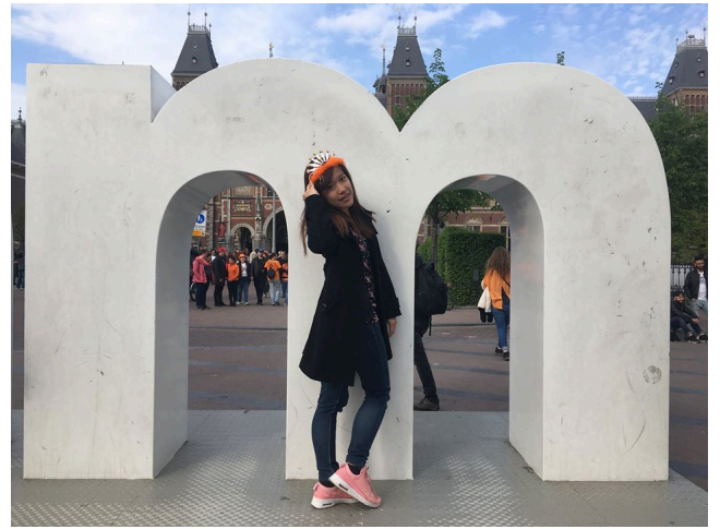
荷蘭國王節 阿姆斯特丹市區一片橘