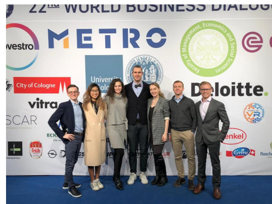
與來自德國、俄羅斯、西班牙、澳洲、印度、巴基斯坦、日本等國的代表合照