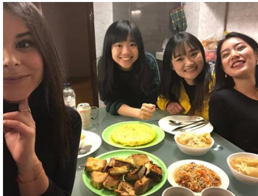
(附圖：和室友一起做晚餐來吃)

我個人使用 Waysitalia 找外宿，單就價格、房子位置，是蠻不錯的。一個月 425 歐元比學校宿舍便宜許多、通勤騎腳踏車到學校才 10 分鐘左右。官方網站有清楚告知有什麼配備，要繳納的費用。因為很多交換生其實都沒抽到宿舍，所以我的室友和住在附近的很多是 Bocconi 的學生，跟來自不同國家的人住在一起、交流是很開心的事情。