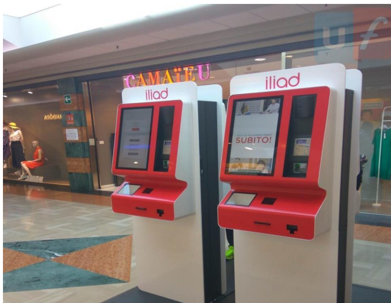
(附圖：取自網路的 iliad 機器)

跟其他電信不同的是 iliad 是直接點選門市裡面的機器，選擇你要的費率，並用信用卡繳費，一開始需要繳交十幾歐元的 sim 卡費用，可以選擇之後要每個月自動扣款還是每個月上網用信用卡充值，選擇完畢 SIM 卡就會製作出來。建議找會講義大利文的朋友或是已經辦過的朋友協助你點選機器的選項，或詢問店員，但我遇到的店員英文不太好。