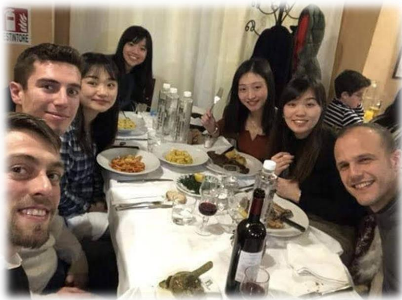
(附圖：和義大利朋友一起吃晚餐)

吃飯要慢慢享受、細嚼慢嚥，通常會吃到兩三個小時，搭食用順序是前菜、主食、點心、咖啡收尾，會搭配酒。基本上我通常習慣點主食來吃而已，因為都點分量太多了，但義大利人真的會從頭吃到尾，吃完之後再聊天，要離開餐廳有時已經半夜十二點了。