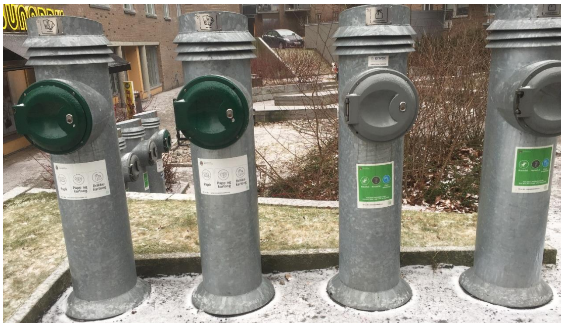
垃圾圓柱，左邊為紙類，右邊為塑膠、廚餘、一般垃圾

在超商購買罐裝飲料時會收取押金，付錢時需付飲料價格加上押金，鋁罐及 600ml 寶特瓶是 1Kr，1L 以上是 2.5Kr，這類回收記得拿去超市內的瓶罐回收機換回押金，放入回收瓶後會給予一張折價紙，可直接到櫃台退零錢或是折抵購物金額。