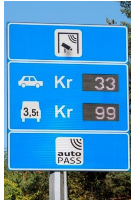
公路過路費皆是電子感應