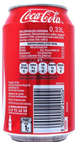
左下標示 1Kr PANT