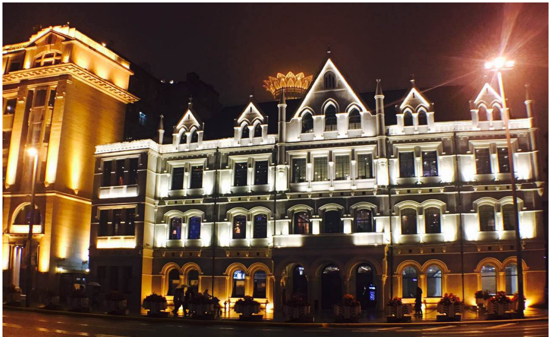
上海外灘—萬國建築