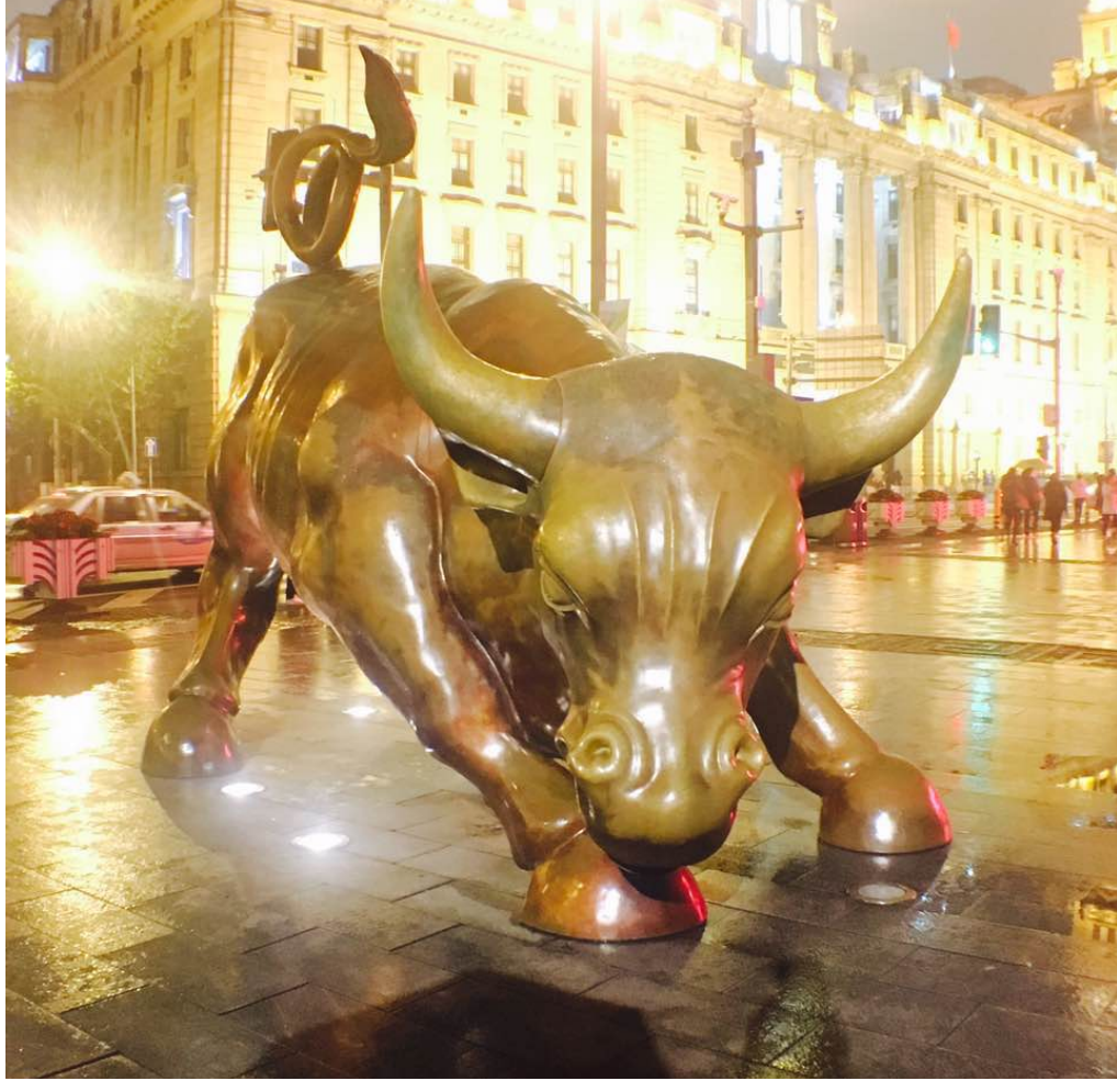
上海外灘—華爾街金牛