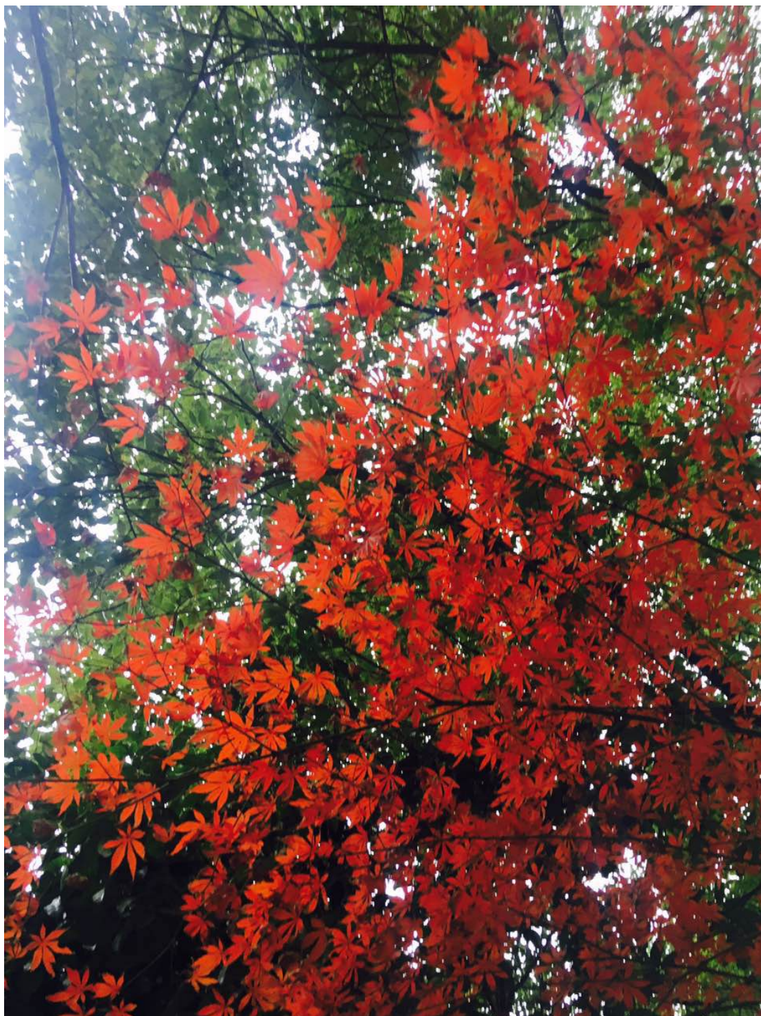
武漢大學楓葉景色