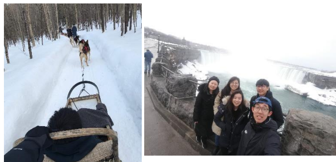
(圖五) 偷偷放個狗拉雪橇跟尼加拉瀑布的圖