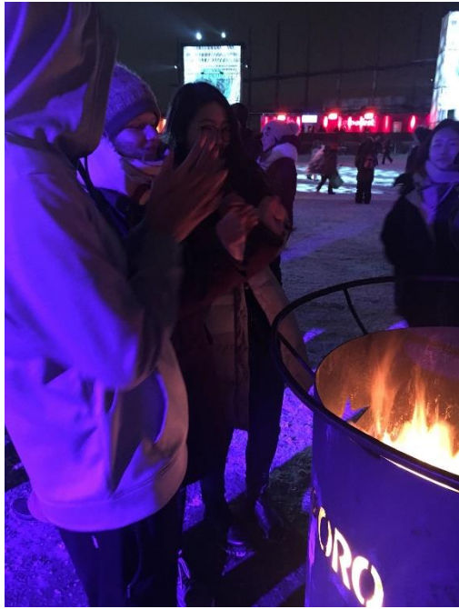
(圖一) Igloofest 的火爐，也有人會烤棉花糖