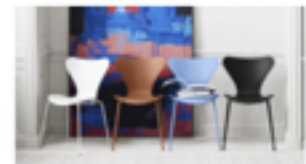
Danish designer Arne Jacobsen