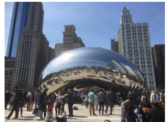
Cloud Gate Chicago 04/09/17

這次我選擇在學期結束後，前往 Chicago 旅行。Chicago 除了有許多城市景點之外，也有很多球賽以及音樂劇可以去看。在查詢這些場次以及買票的部分建議可以上 ticketmaster.com 或 stubhub.com 等購票網站去看看有無有興趣的活動。