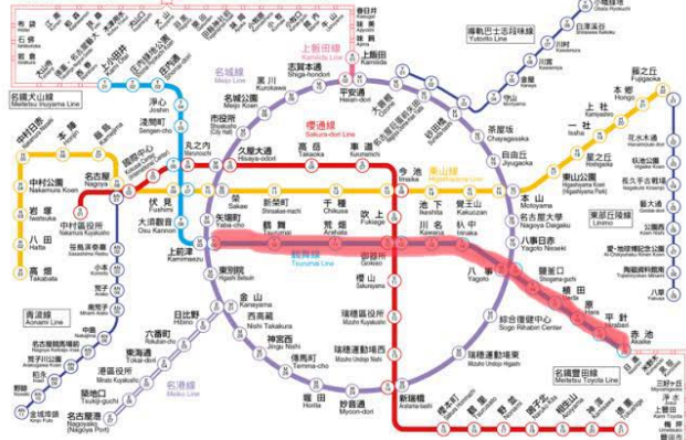
名古屋市營地下鐵路線圖 Nagoya Subway Network

如果從上前津「一條直線」畫到赤池的話，一個月與三個月的大學生票價分別是6090與17360