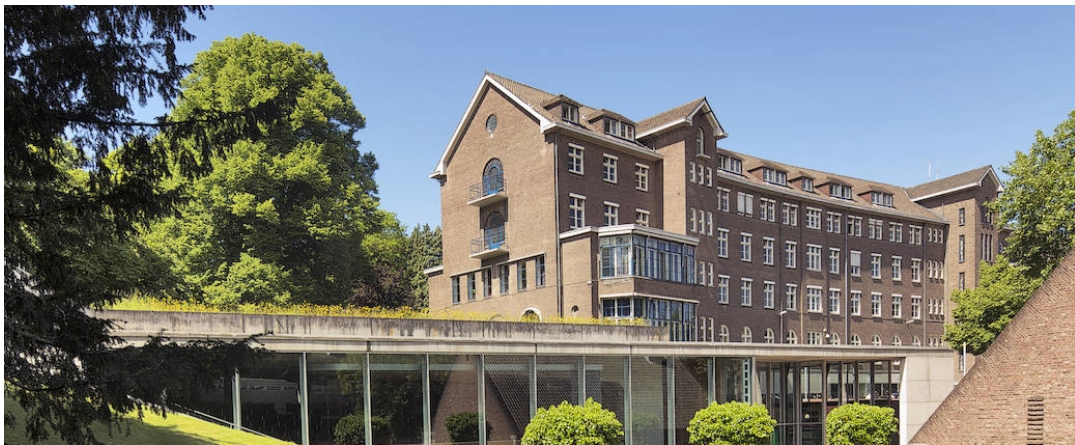
經濟與管理學院（SBE）大樓

馬斯垂克大學位在荷蘭南邊的馬斯垂克市，地理位置鄰近比利時和德國，成立於1976年，是當時林堡省政府希望培育研究型人才和活絡南方經濟而設立的年輕大學。國際學生佔44%，大部分課程都是英文授課，課堂上會遇到來自歐洲各地、甚至美洲的同學。馬大的經濟管理學院（SBE）非常出名，很特別的是採用Problem-Based Learning（PBL）的小班制討論課教學方式，並且要求正規生一定要出國交換，畢業前還得完成論文。推薦馬斯垂克大學給想體驗國際化的上課環境、想練習英文、喜歡生活在悠閒美麗的小城市、又想方便搭廉航和巴士到歐洲各地遊玩的人來交換。