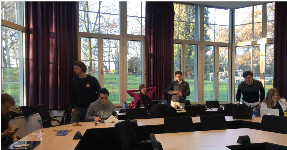
最後一堂期末報告

Final paper也是3000字，教授提供outline，可以選擇喜歡的主題自由發揮。