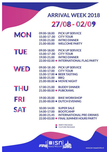
ISN arrival week 活動

ISN是一個旨在促進國際學生文化交流的學生組織，從學期初就舉辦一系列活動，包括 arrival week、party和culture package、週末discover系列的各國旅遊、學期間各種party和Cantus。他們定期會寄電子報到信箱，有興趣的人也可以追蹤粉專，會有即時活動資訊。想認識各國朋友、體驗外國party文化的人可以參加，但也不是所有活動都是好評。我參加過的Beer Tasting不錯，也推薦它的ESN card，搭Ryanair打折還有免費托運行李。