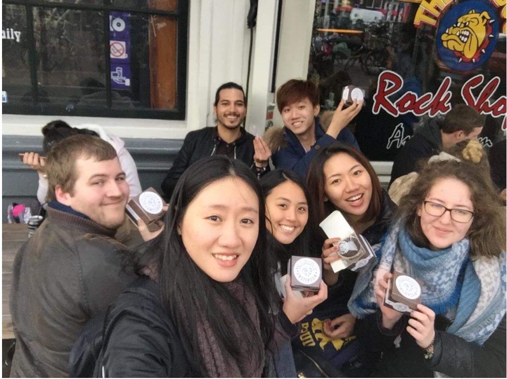
(和朋友們一起去荷蘭)